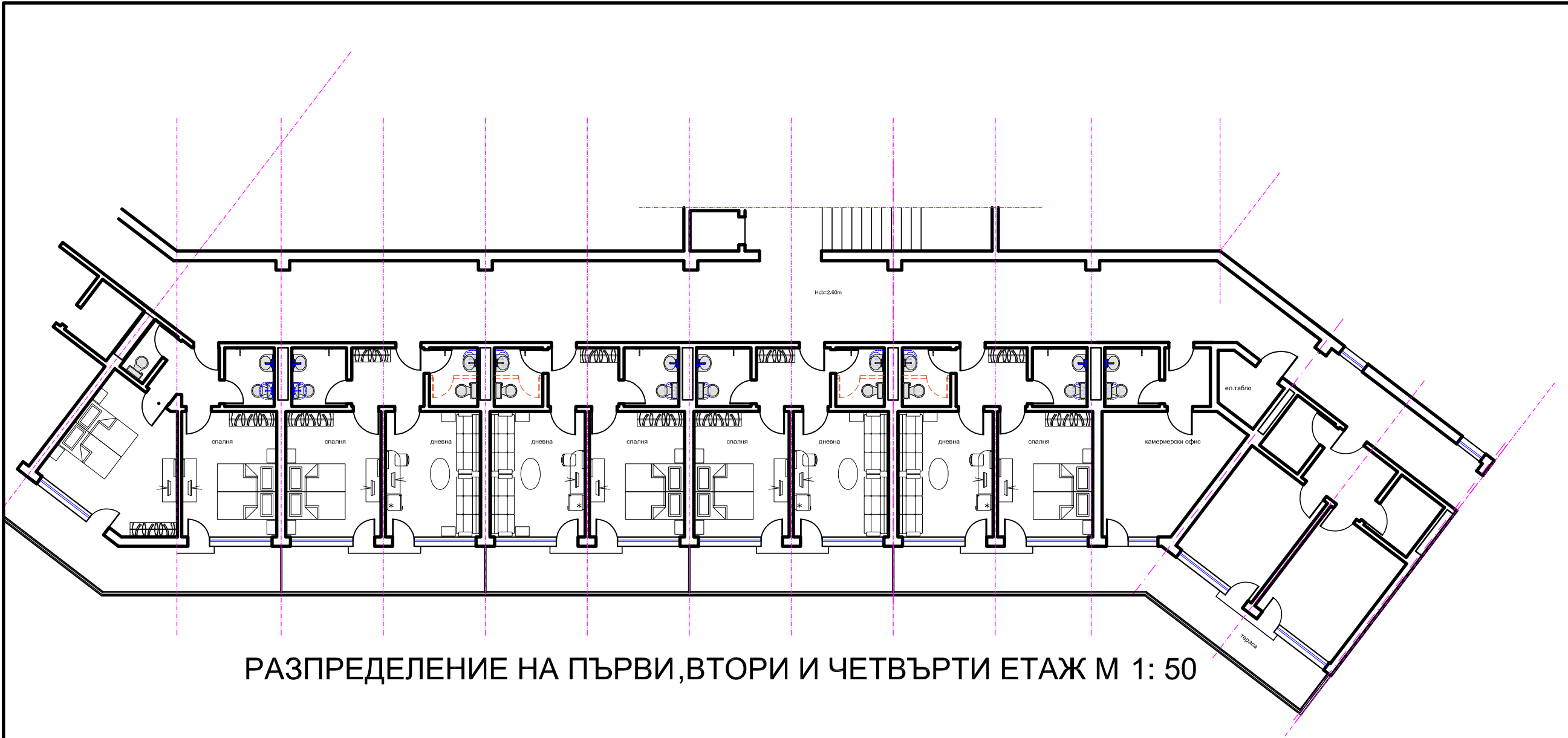
РАЗПРЕДЕЛЕНИЕ НА ПЪРВИ,ВТОРИ И ЧЕТВЪРТИ ЕТАЖ М 1: 50