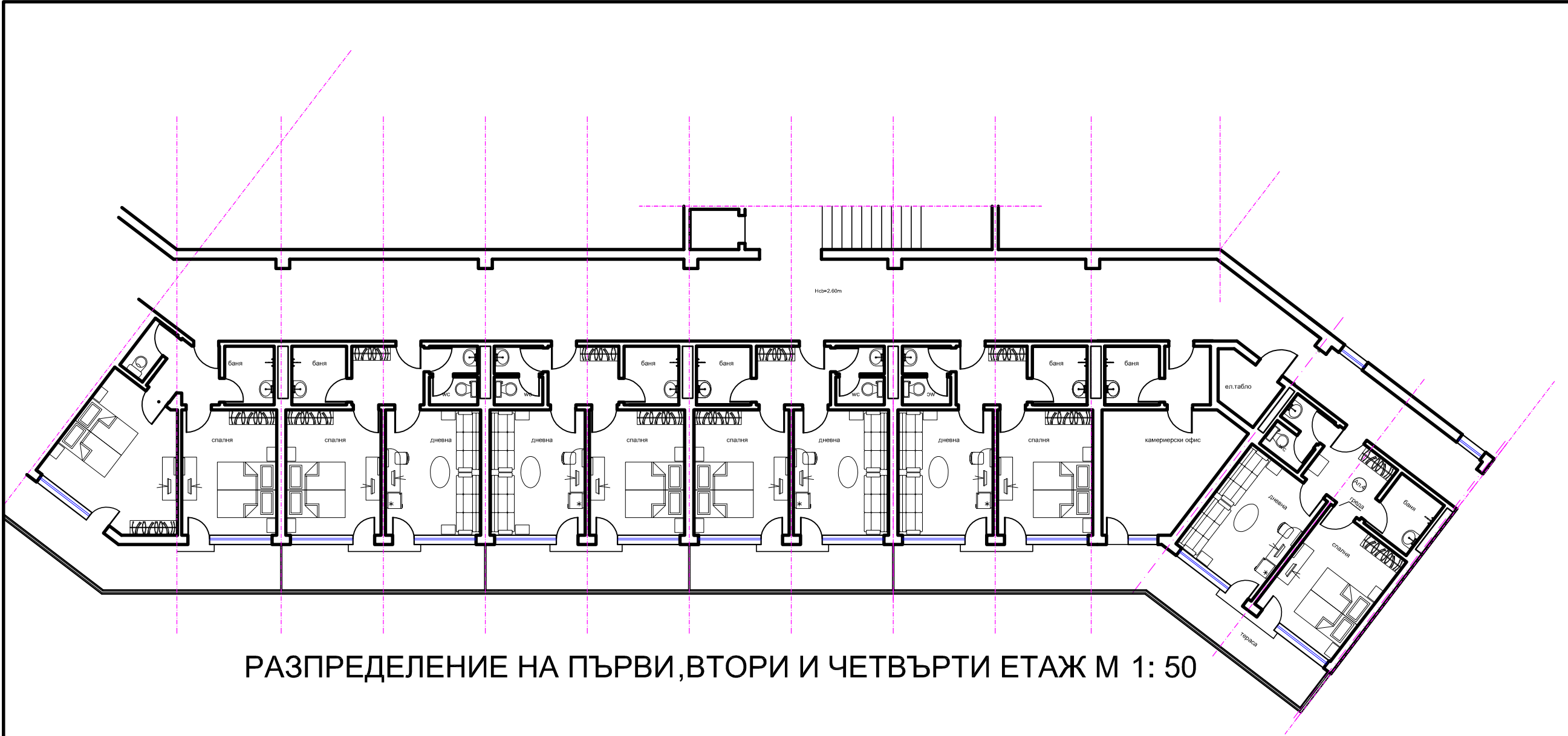
РАЗПРЕДЕЛЕНИЕ НА ПЪРВИ,ВТОРИ И ЧЕТВЪРТИ ЕТАЖ М 1: 50