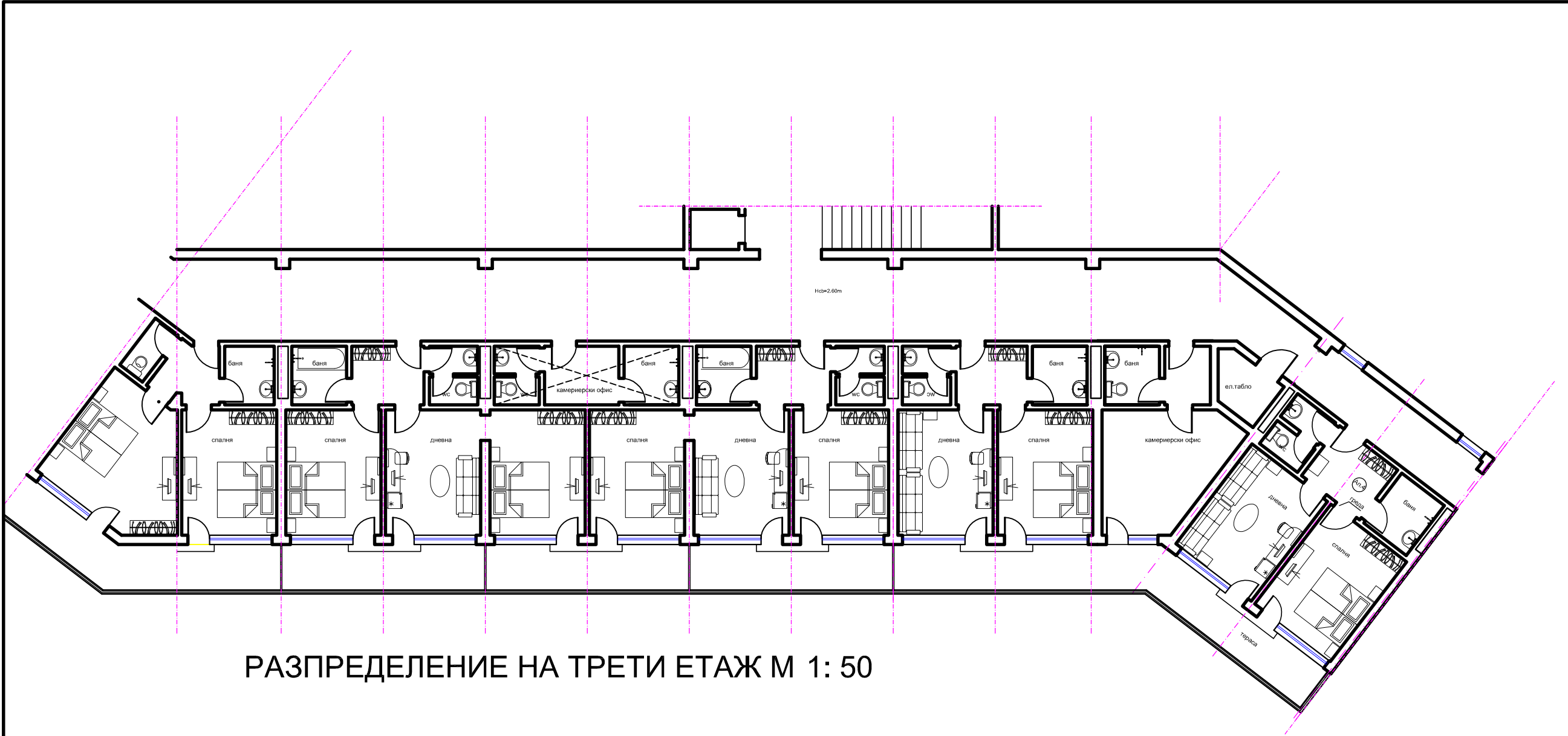
РАЗПРЕДЕЛЕНИЕ НА ТРЕТИ ЕТАЖ М 1: 50